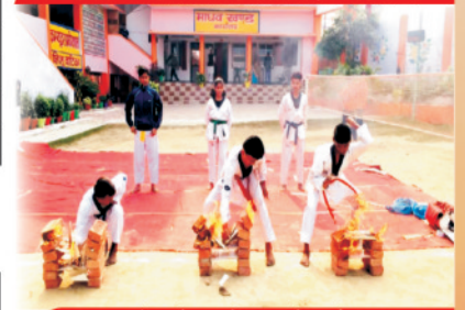
विद्यालय में मार्शल आर्ट का प्रदर्शन करते विद्यालय के भैया/बहिन