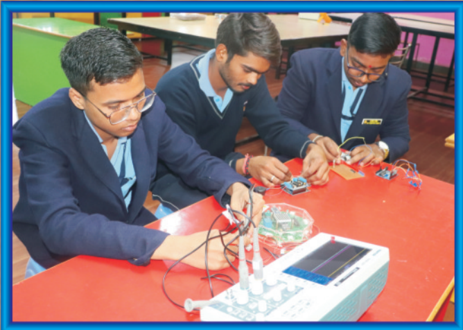
अटल टिकरिंग लैब में प्रयोग करते भैया