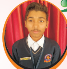
Anurag Pratap Singh Prime Minister