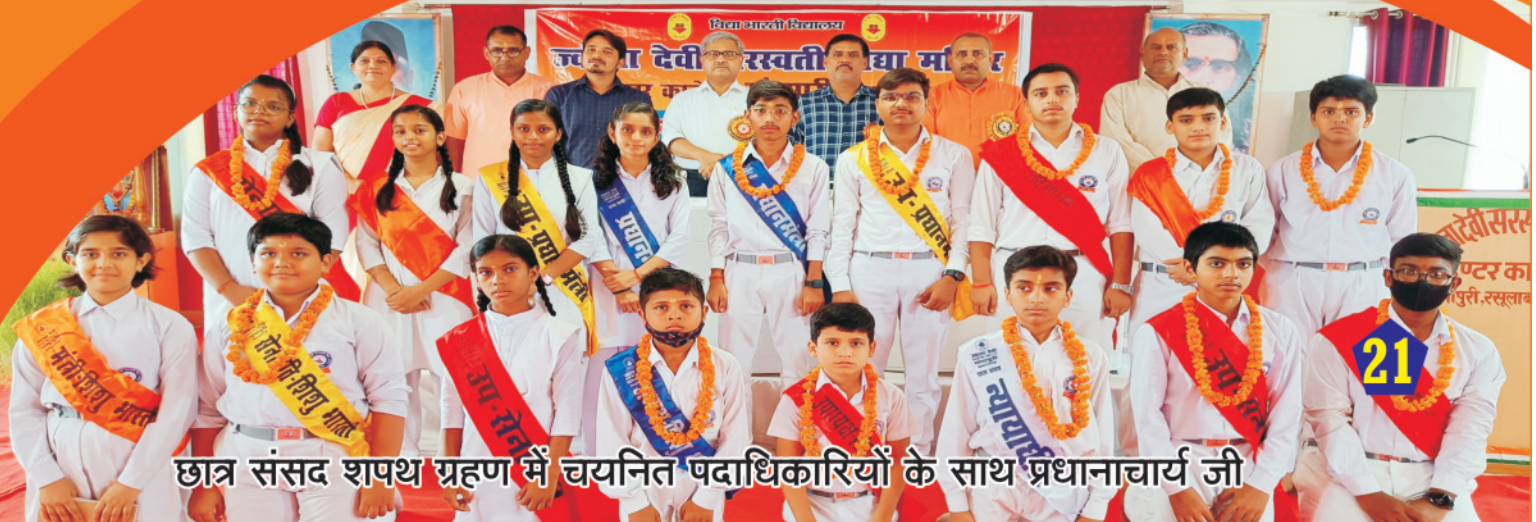
छात्र संसद शपथ ग्रहण में चयनित पदाधिकारियों के साथ प्रधानाचार्य जी