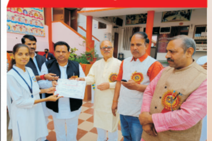
आई.आई.टी. में 2 दिवसीय कार्यशाला में प्रतिभागी बहिन को प्रमाण पत्र प्रदान करने प्रदेश निरीक्षक काशी प्रान्त