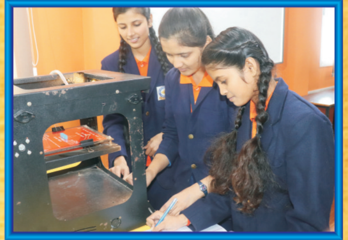
3डी प्रिन्टिंग द्वारा प्रोजेक्ट तैयार करती विद्यालय की बहिनें