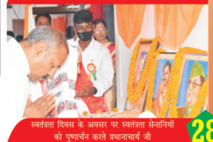
स्वतंत्रता दिवस के अवसर पर स्वतंत्रता सेनानियों को पुष्पार्चन करते प्रधानाचार्य जी