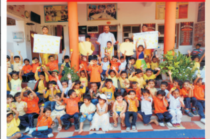
एकटीक्रीडा ग्रुप में प्रधानाचार्य जी