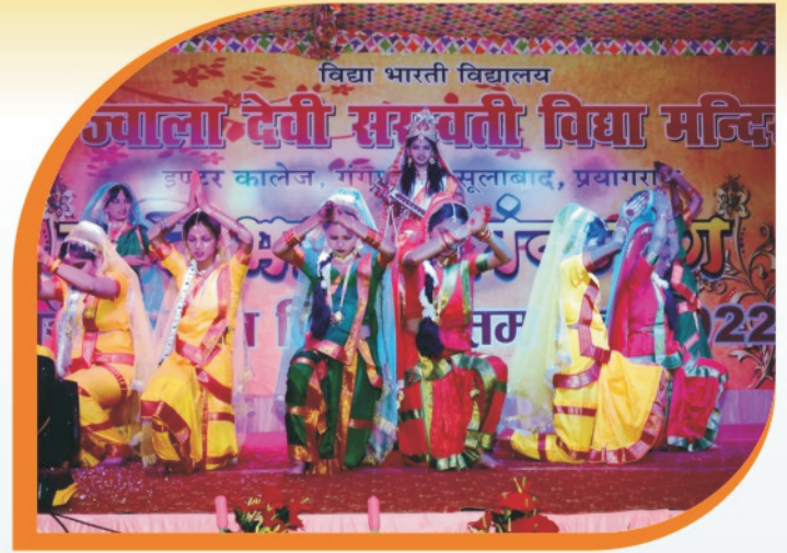
प्रतिभा अलंकरण समारोह में विद्यालय के भैया/ बहिनों के द्वारा नृत्य की मनमोहक प्रस्तुति