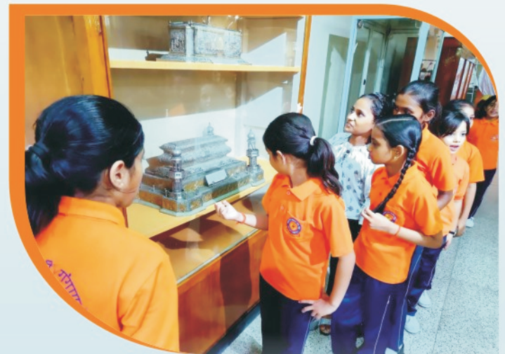
शैक्षिक एवं शिक्षणेत्तर यात्रा के अन्तर्गत इलाहाबाद संग्रहालय का भ्रमण