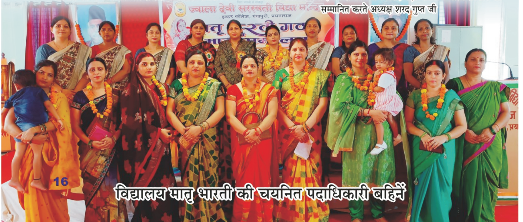
विद्यालय मातृ भारती की चयनित पदाधिकारी बहिनें