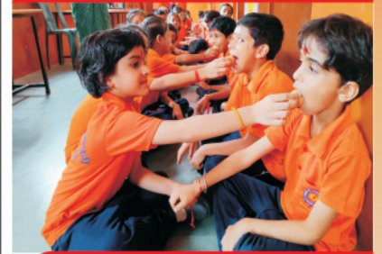
रक्षा बन्धन के अवसर पर रक्षा सूत्र बाँधती बहनें