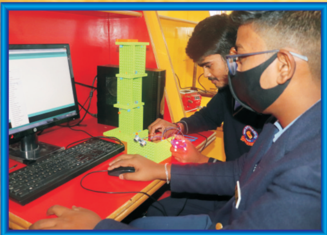
कम्प्यूटर द्वारा प्रायोगिक प्रोजेक्ट तैयार करते भैया