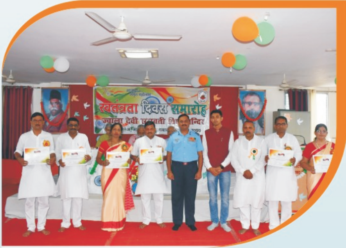
कविता काव्य कोष की ओर से सम्मानित अध्यापकगण