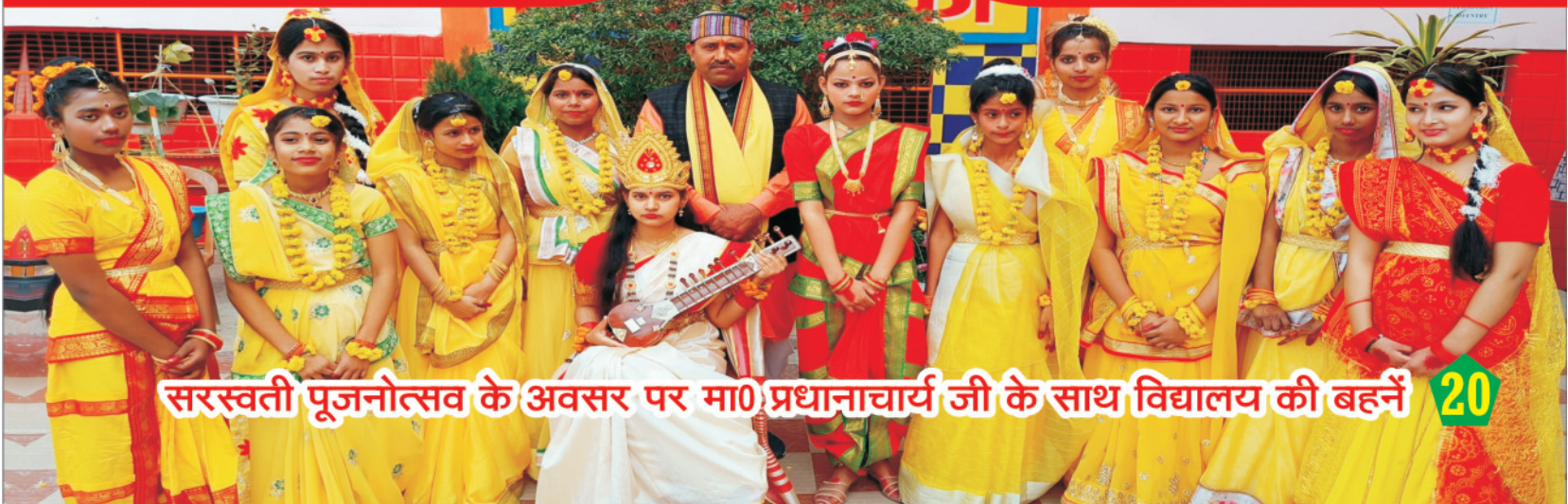
सरस्वती पूजनोत्सव के अवसर पर मा० प्रधानाचार्य जी के साथ विद्यालय की बहनें