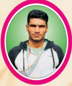
भैया सुशील कुमार राष्ट्रीय स्तर कुश्ती - स्वर्ण