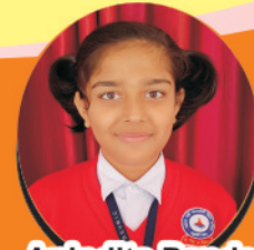
Anindita Pandey Minister Shishu Bharati