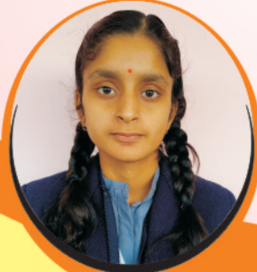
Aditi Mishra Prime Minister Kanya Bharati