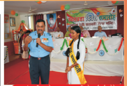
स्वतंत्रता दिवस के अवसर पर छात्रों को मार्गदर्शन देते अतिथि